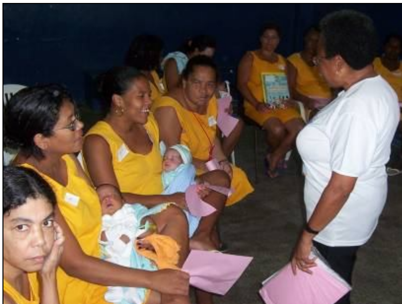
Cursus in de vrouwengevangenis van Salvador

Wij hadden in Salvador al een opvang met het Centrum Nova Semente (Nieuw Zaadje) wat de uitbouw van het pilootproject zou vergemakkelijken. Eerst dachten we er aan om via de gevangenen ouders hun families (en kinderen) te gaan bezoeken, maar dat stootte op heel wat weerstand. Zowel bij de vrijwilligers van de kinderpastoraal die terugdeinsden bij het idee om families van “criminelen” te gaan bezoeken, als bij de families zelf die dachten dat ze door de gevangenis gestuurd waren om te komen “controleren”. Vandaar dat het idee groeide om de vormingscursus voor leid(st)ers in de kinderpastoraal in de gevangenis zelf te geven. Met die informatie zouden ze beter hun kinderen onthalen op de bezochtdag, de borstvoeding gestimuleerd worden voor babies die tot zes maanden bij de moeder mogen blijven en na de gevangenschap zich makkelijker terug integreren als gevormde leidster van de kinderpastoraal.