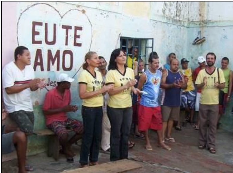
Politiegevangenis Barreiras/ gevangensequipe in actie