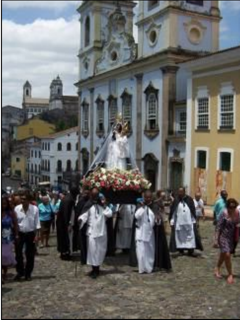
Processie t.g.v. de dag van het zwarte zelfbewustzijn aan de Rosariokerk – Pelourinho- Salvador

Dankzij een overheidsprogramma (bolsa família, te vergelijken met het kindergeld) ter ondersteuning van gezinnen met een laag inkomen, op voorwaarde dat de kinderen naar school gaan en ingeënt zijn, is de honger en de armoede vermindert.