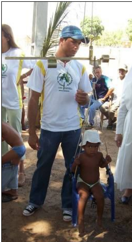
Barreiras/ weging van de kinderen op het platteland

Er zijn zelfs al ex-gevangenen die als vrijwilligsters met de opgedane kennis kinderen begeleiden in hun gemeenschap en zich op die manier zich sneller herintegrenen.